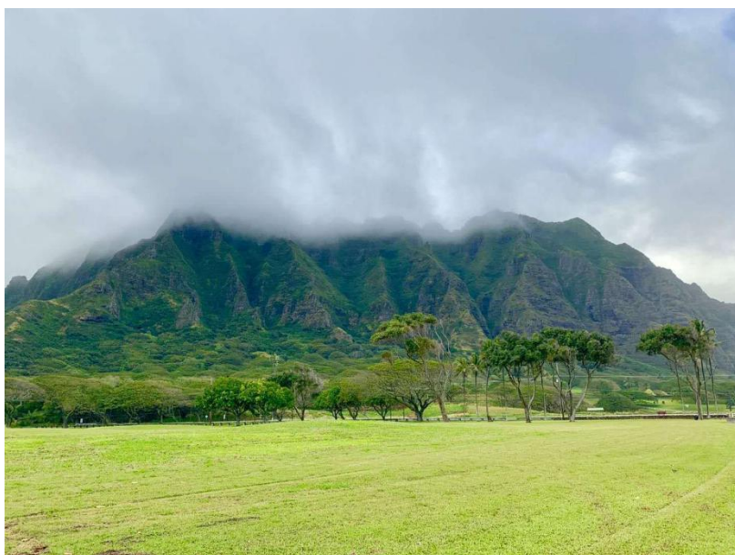
图片 2：夏威夷北岸风光