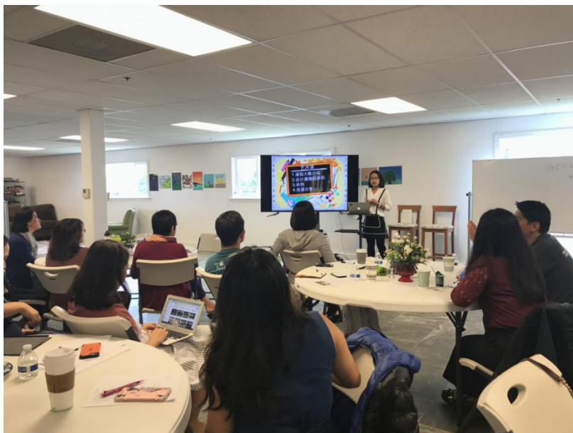
图片 4：沉浸式中文艺术课介绍

方法，在夏威夷 Maryknoll School（玛丽诺学校）沉浸式汉语项目任教的孔院教师则介绍了幼儿园学生艺术课和一年级学生数学课的教学情况。