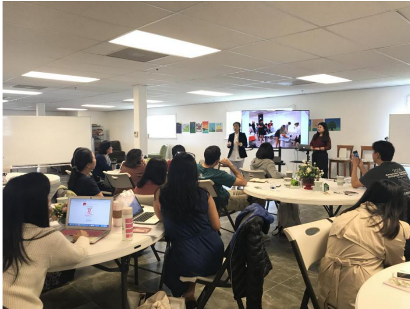
图片 6：夏威夷大学孔子学院教师分享汉字教学经验