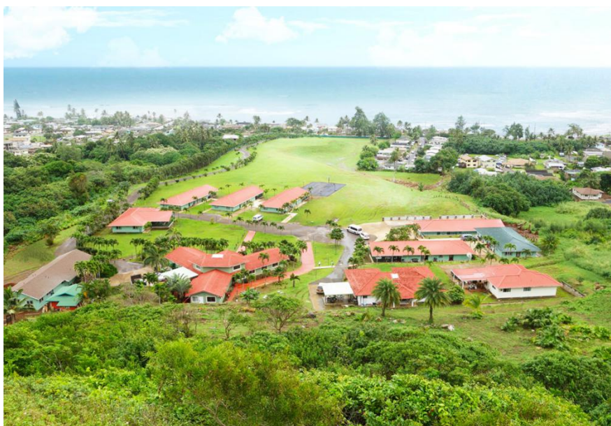
图片 7：夏威夷亚太国际学校校园