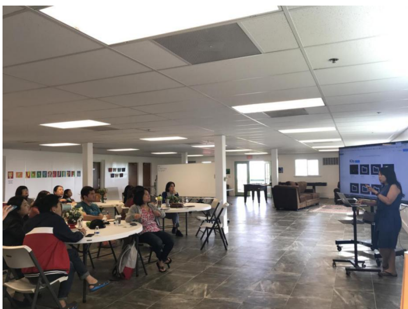
图片 3：中文教学资源分享

在教学研讨环节，来自‘Iolani School（伊奥拉尼学校）、夏威夷亚太国际学校、Island Pacific Academy（太平洋岛学院）等学校的一线中文教师带大家体验了实用有趣的教学软件，分享了针对不同年龄段学习者的中文教学活动和资源。