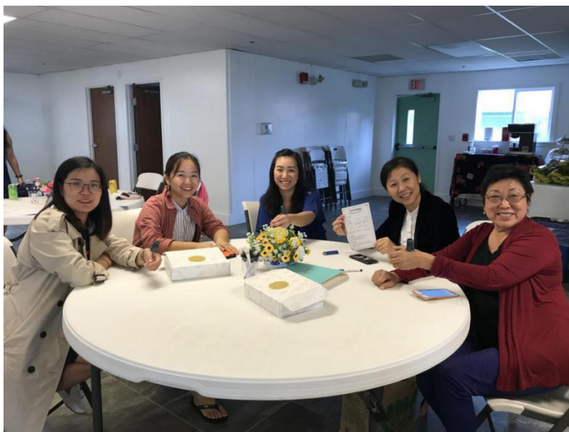
图片 10：体验中医文化——艾灸

下午的“中文活动小站”也十分有趣。老师们互相切磋如何在中文课堂利用麻将进行数字和文化教学，体验中医文化——艾灸，以及针对幼儿园和小学生的泥塑。如果将这些活动带入未来中文课堂，一定会更加提高教学的趣味性，赢得学生们的喜爱。